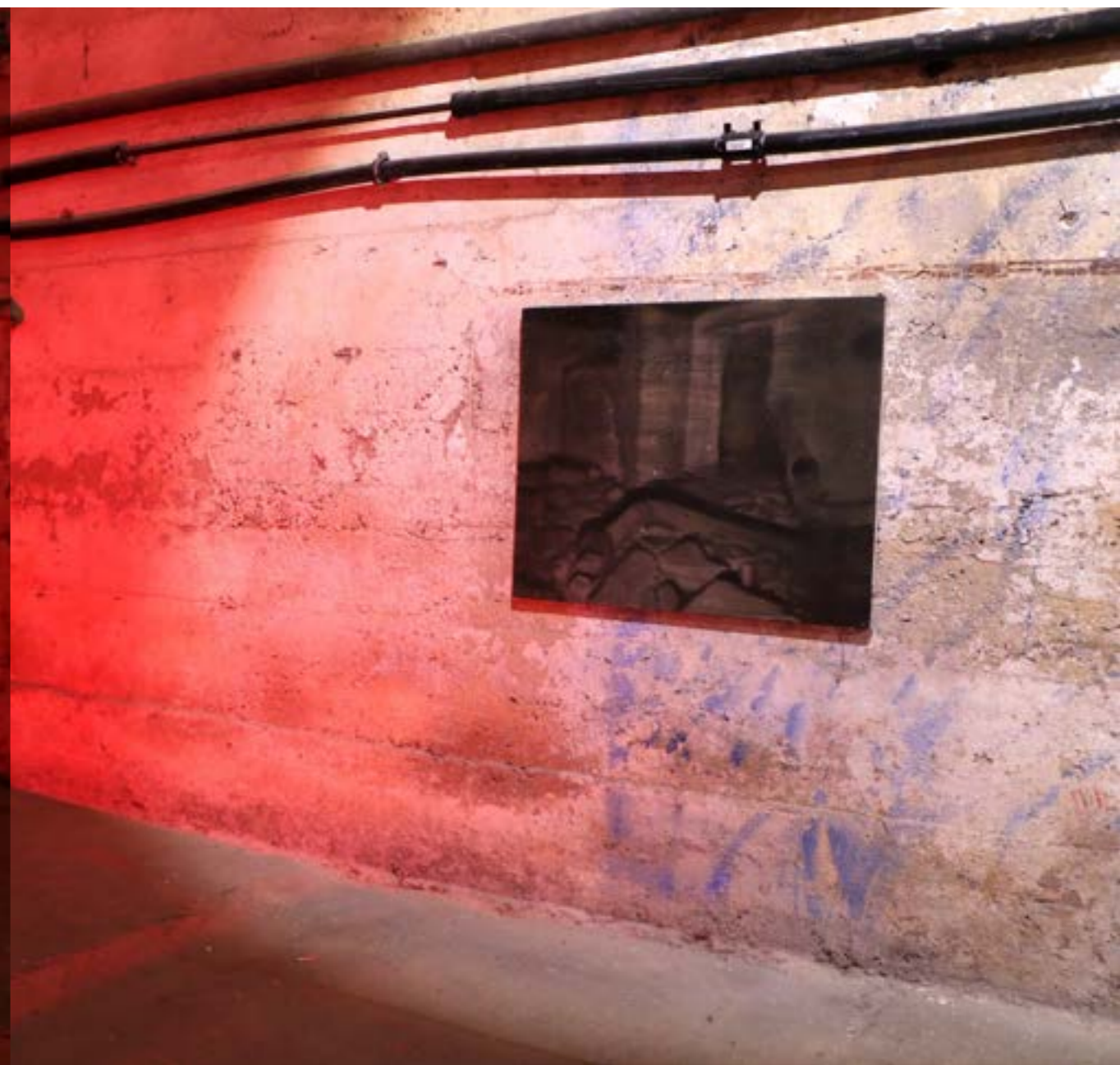
vues d'exposition Le Puits du Dindon , avec le collectif Bétonite, à la BCDM, Strasbourg, 2025