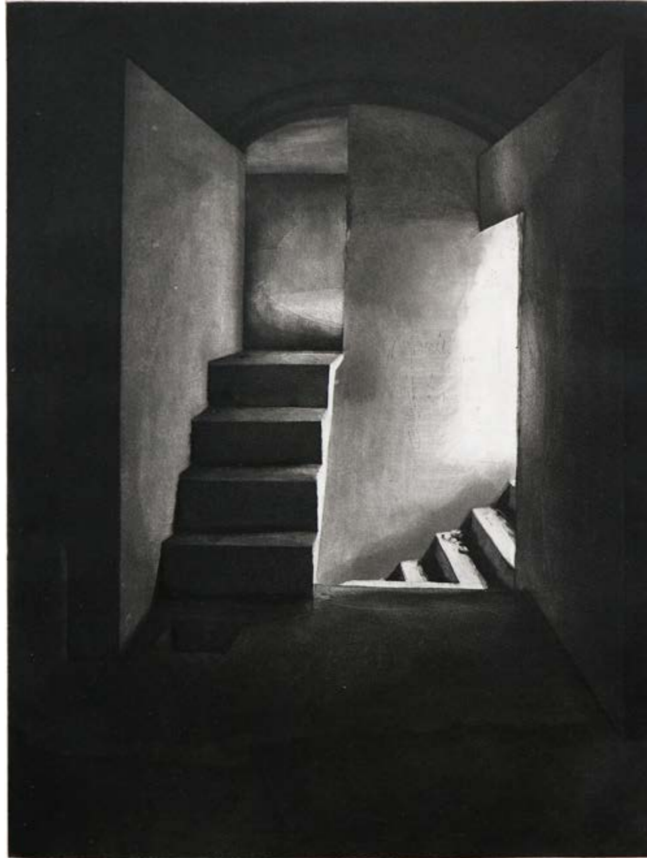
Escaliers , 2023, aquatinte et pointe sèche, 30x40 cm