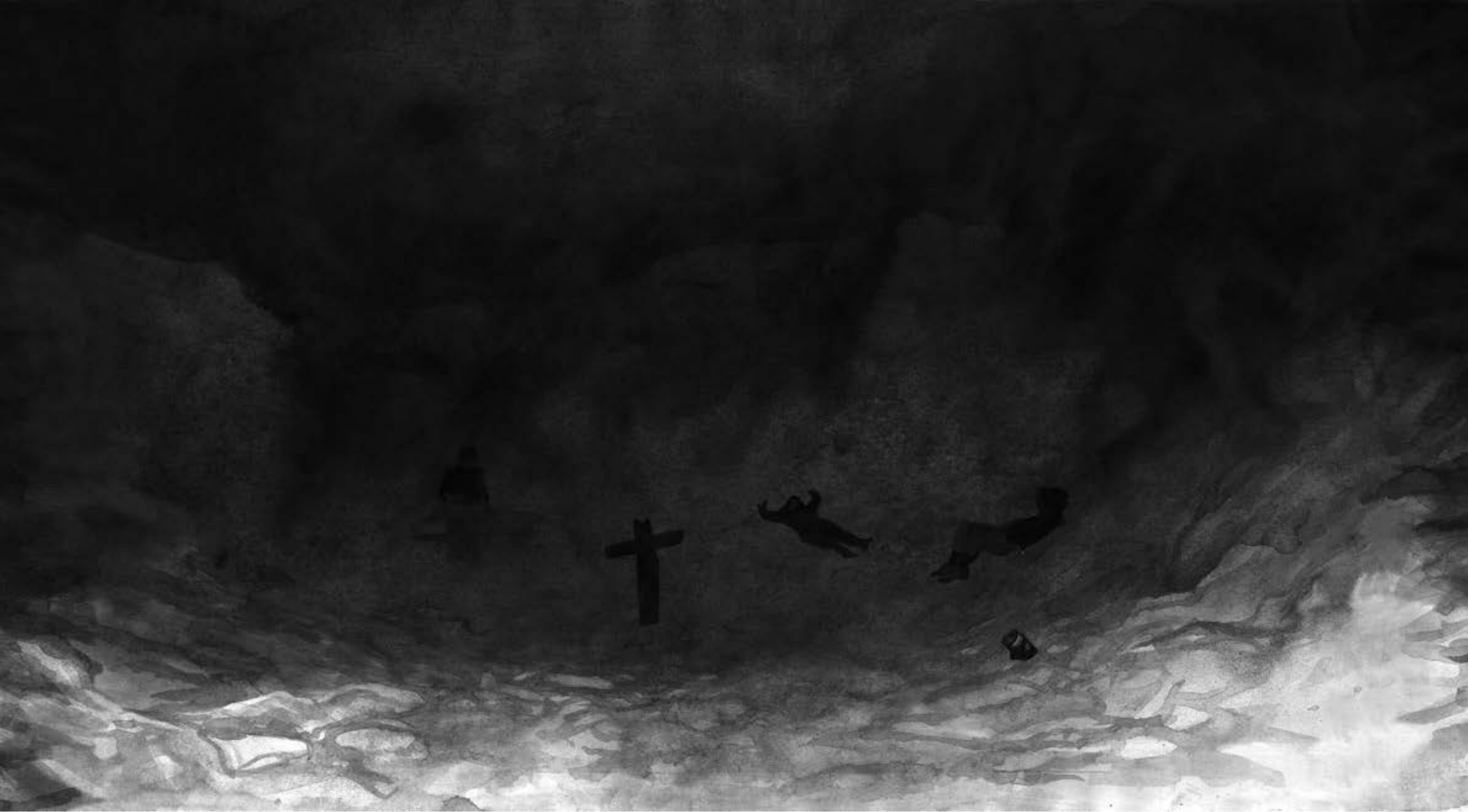
Endzone , 2024, lavis sur papier, 31x49 cm