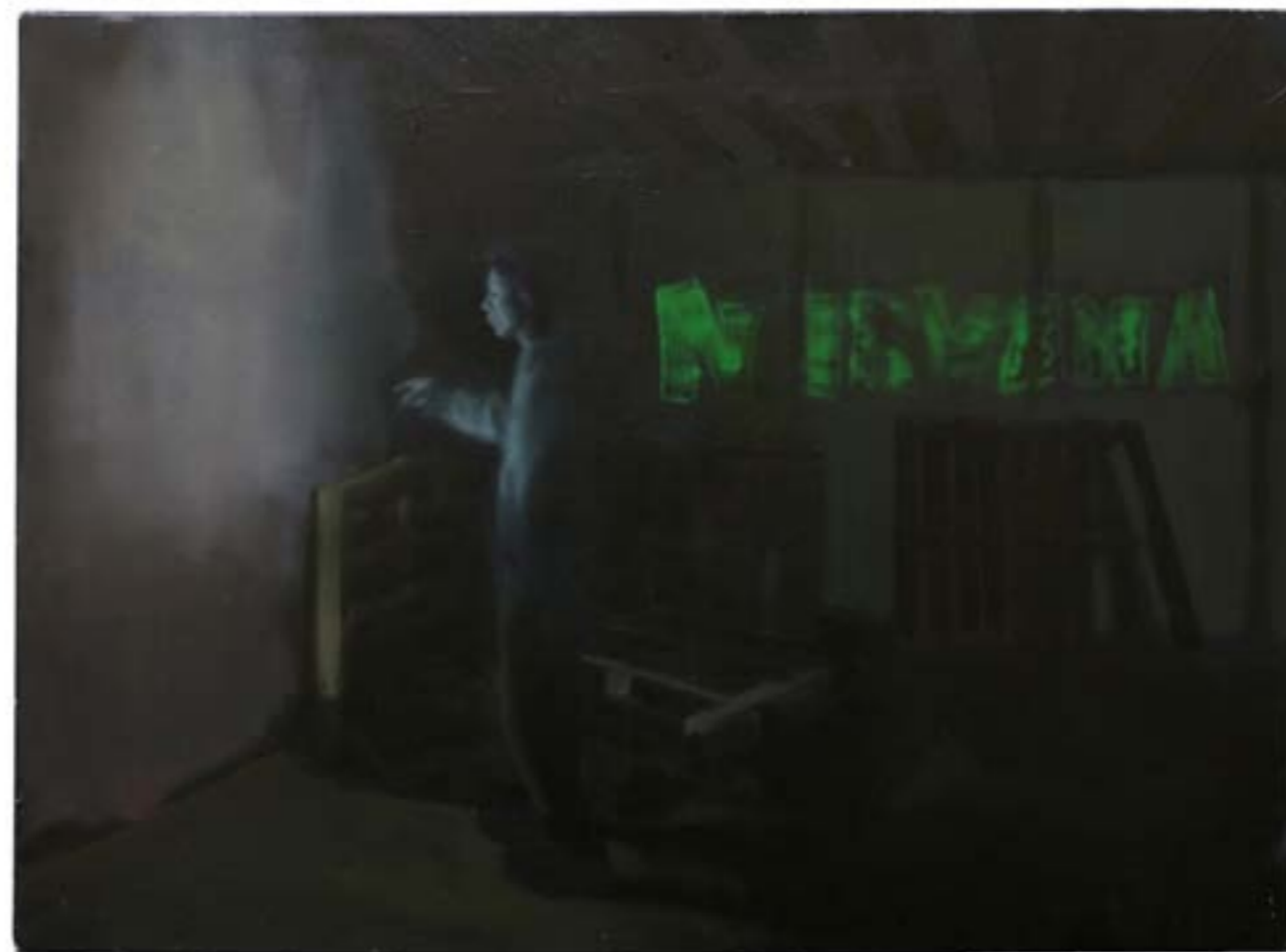
Nirvana , 2022, détrempe et huile sur toile, 54x73 cm