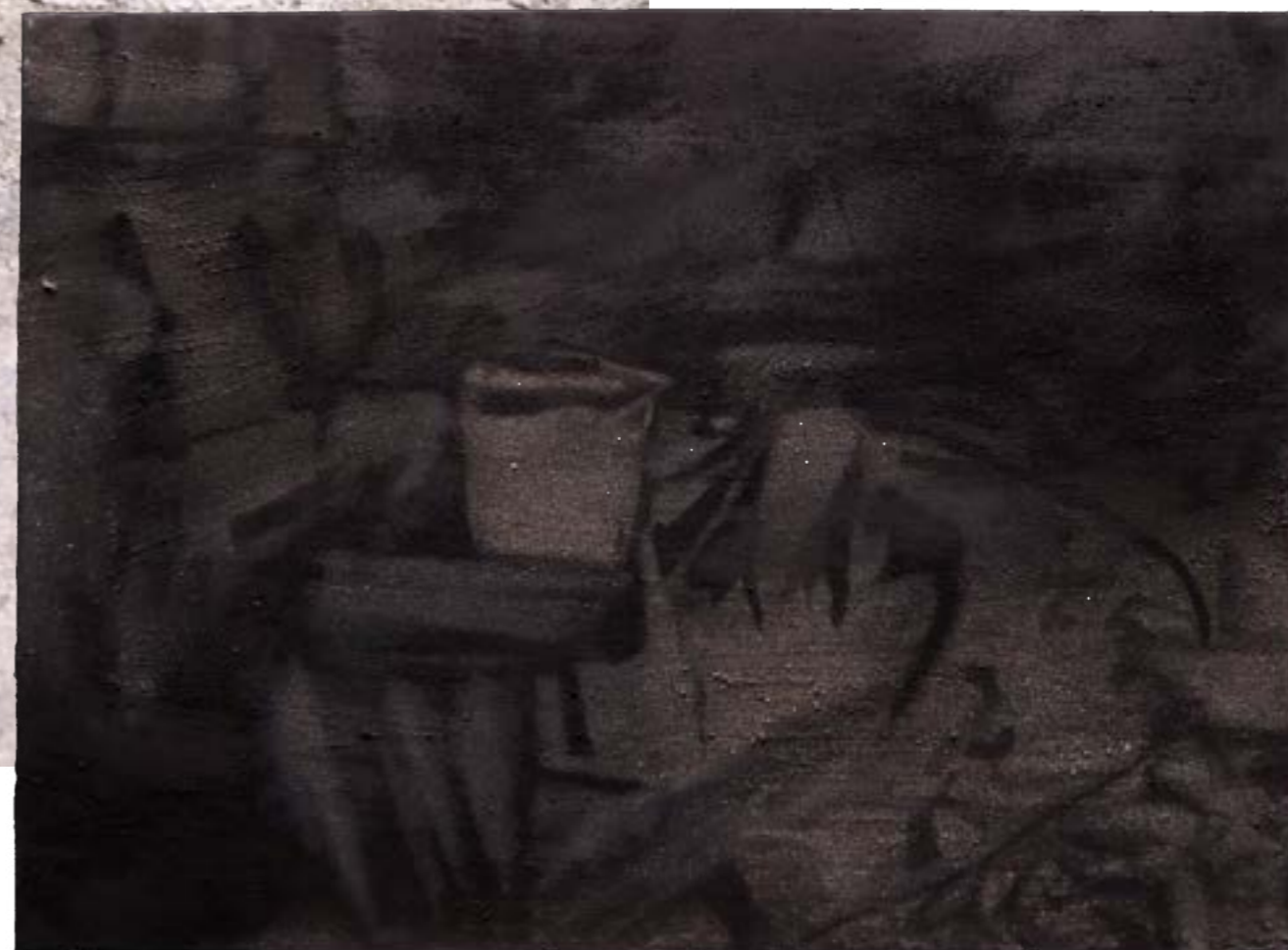
Minéralisation , 2025, sable, pigment et huile sur toile, 54x73 cm