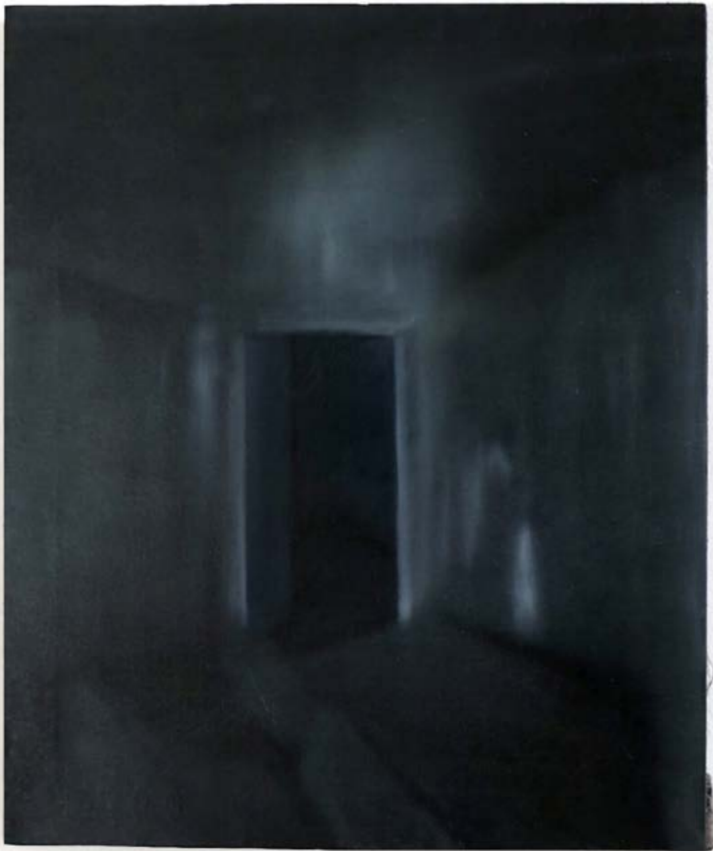
Ashes and ghosts , 2024, huile sur toile, 54x65 cm