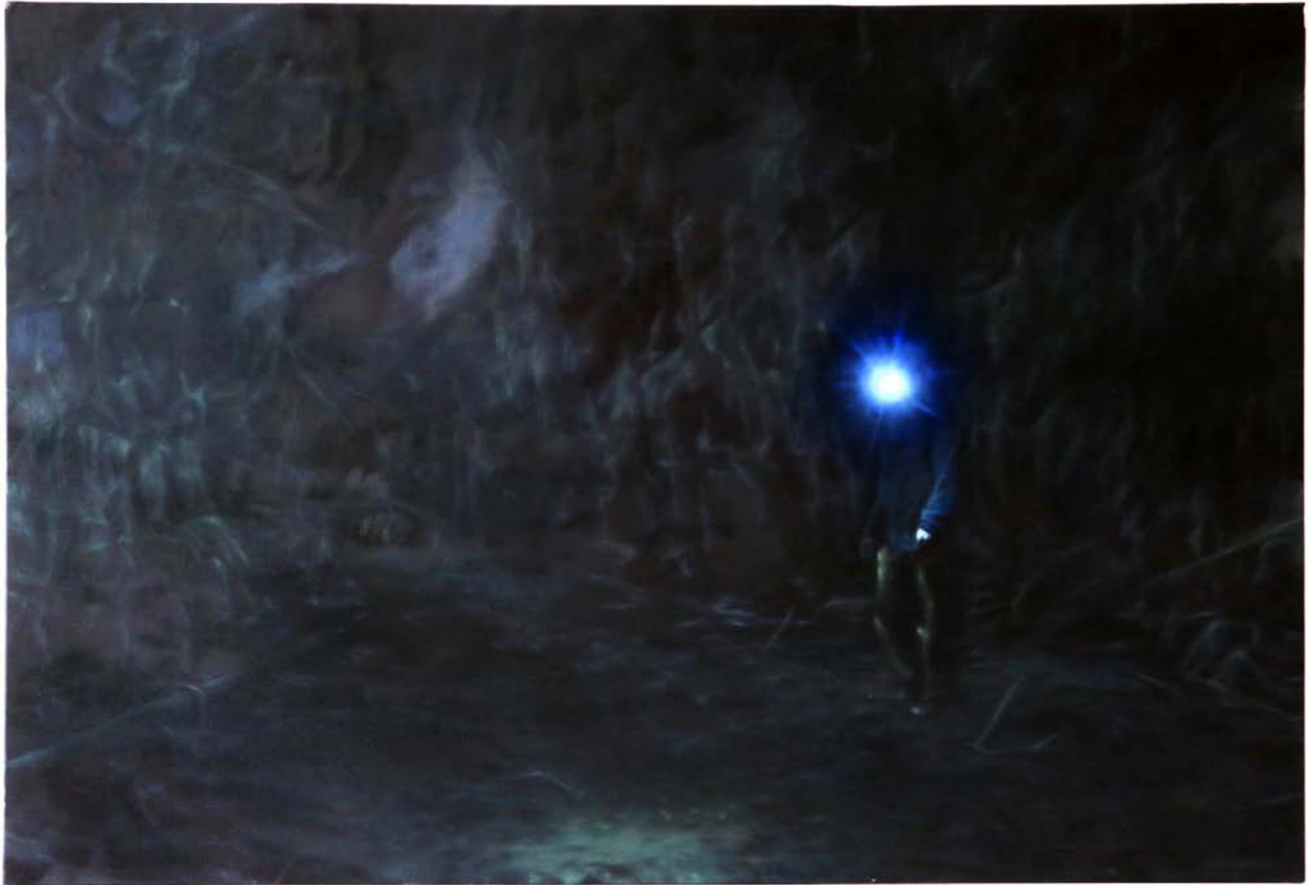
Black fog , 2024, détrempe et huile sur toile, 110x170 cm