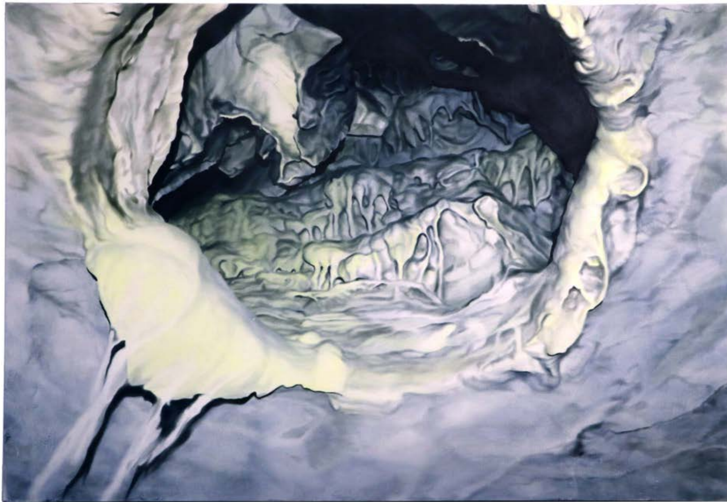
Plic-Ploc , 2025, huile sur toile, 200x135 cm