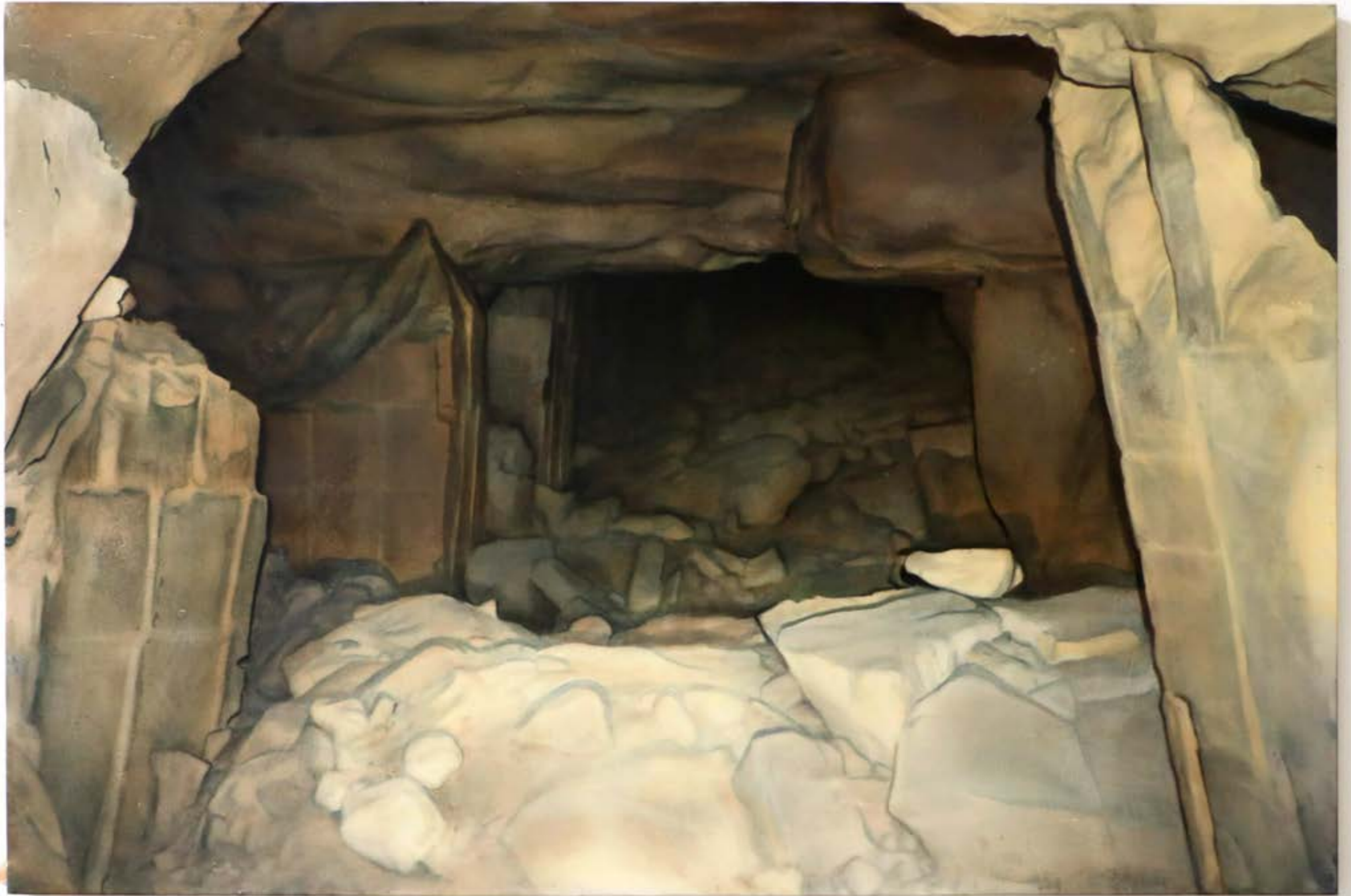
Grotte du chaos , 2024, huile sur toile, 190x125 cm