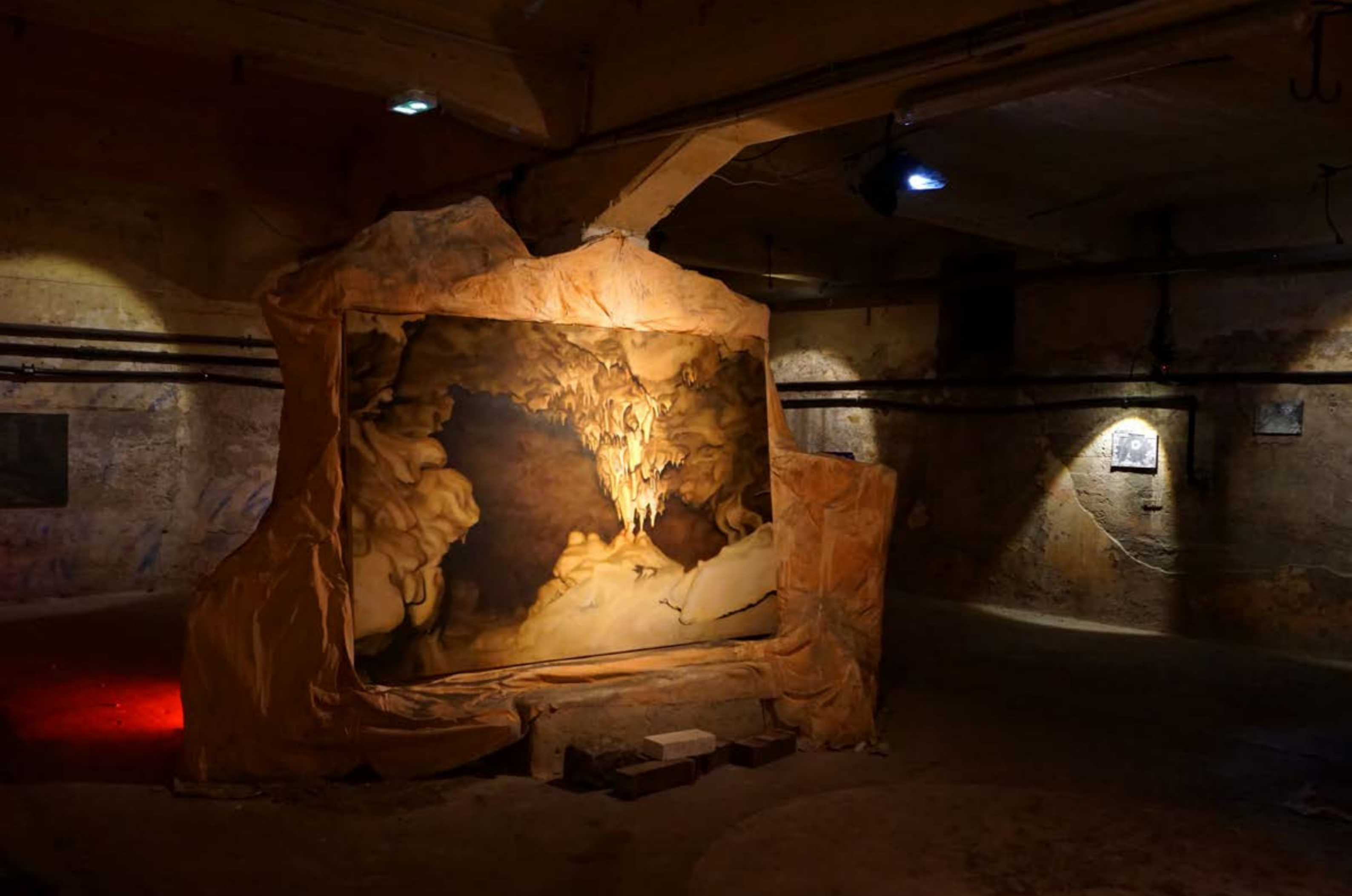
Gouttes de Léthé, et installation in-situ pour Le Puits du Dindon, avec le collectif Bétonite à la BCDM, Strasbourg, 2025