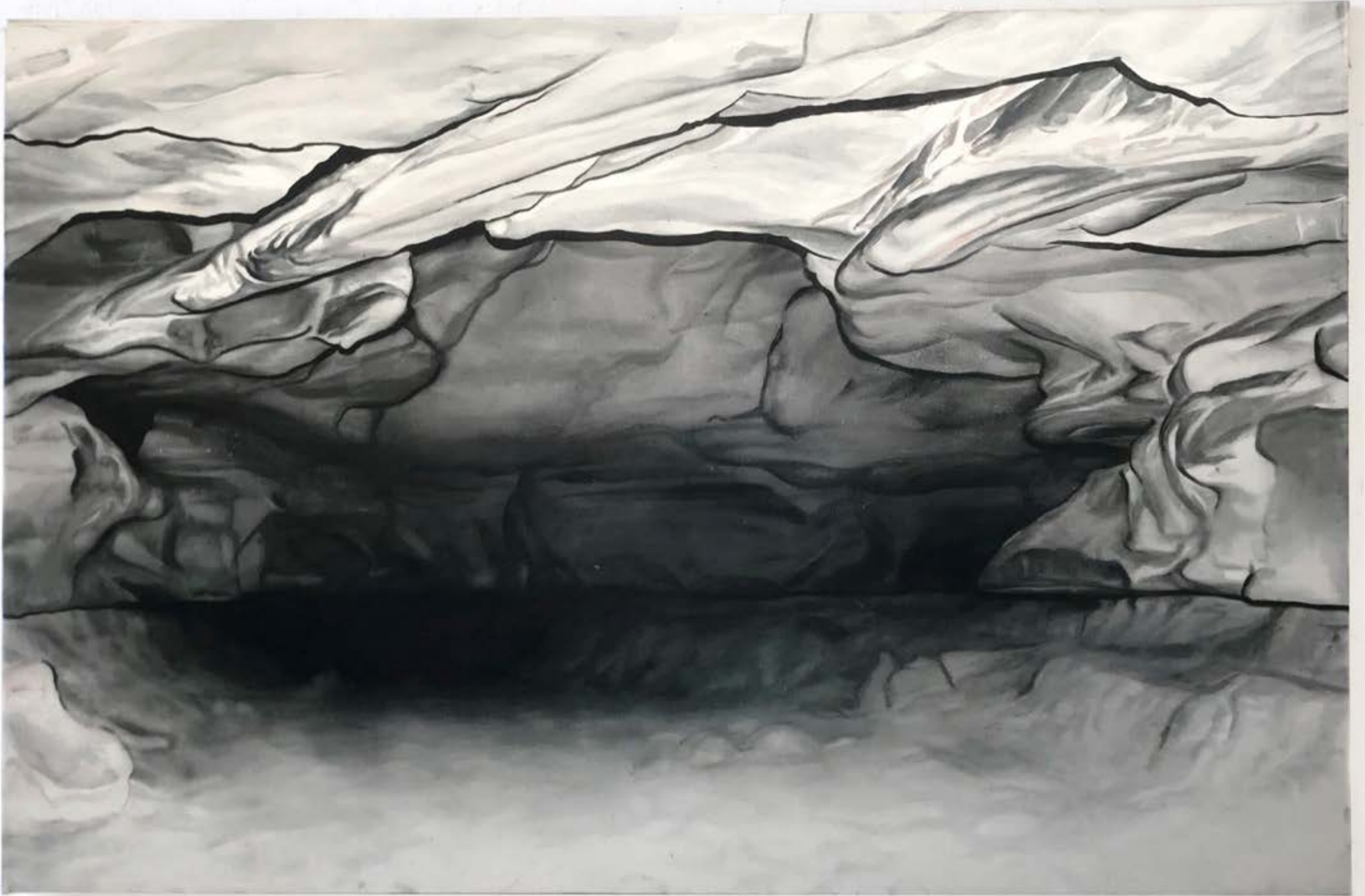
Entrée principale, 2024, huile sur toile, 200x135cm