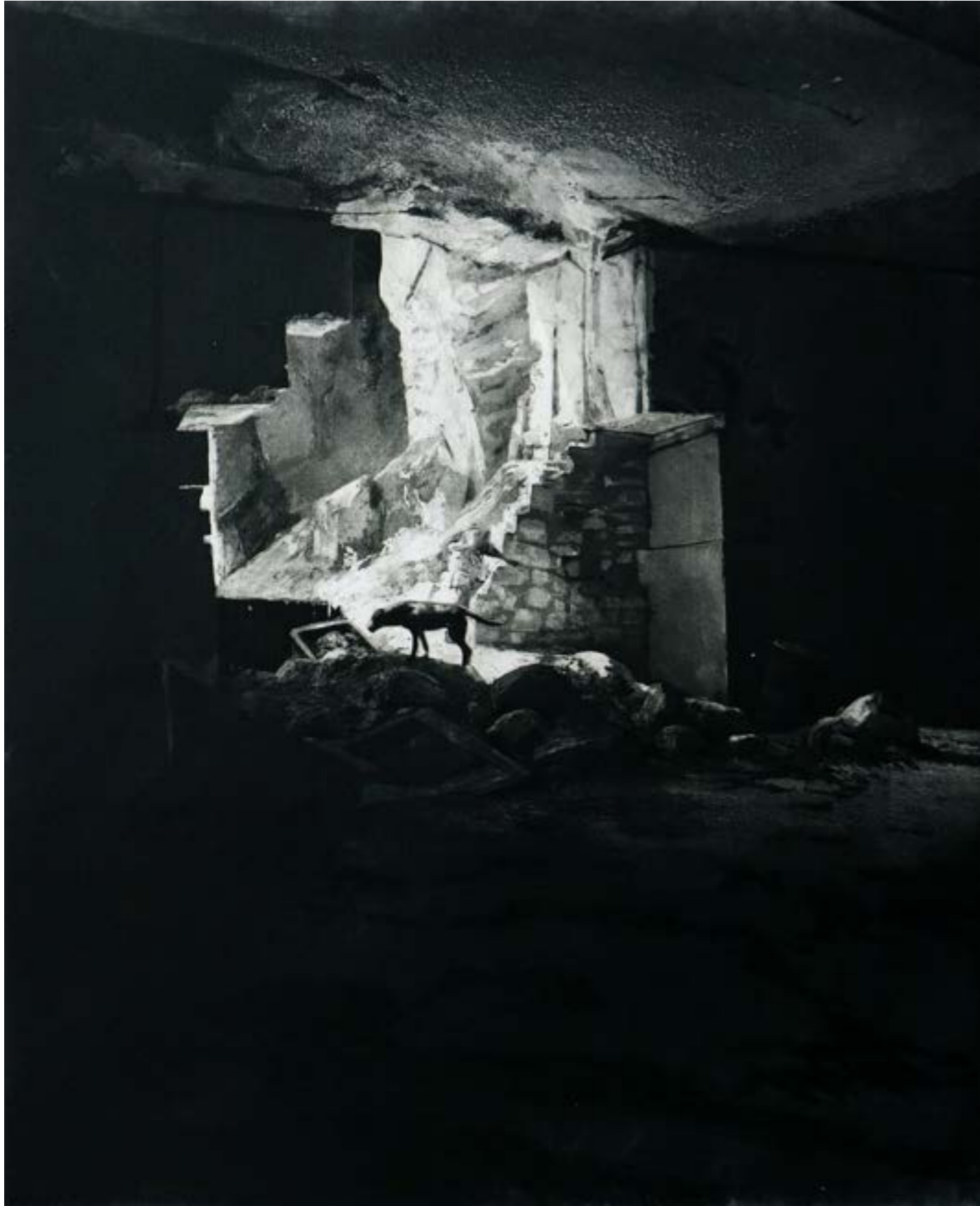
Chien errant (1) , 2023, aquatinte et pointe sèche, 39x48 cm