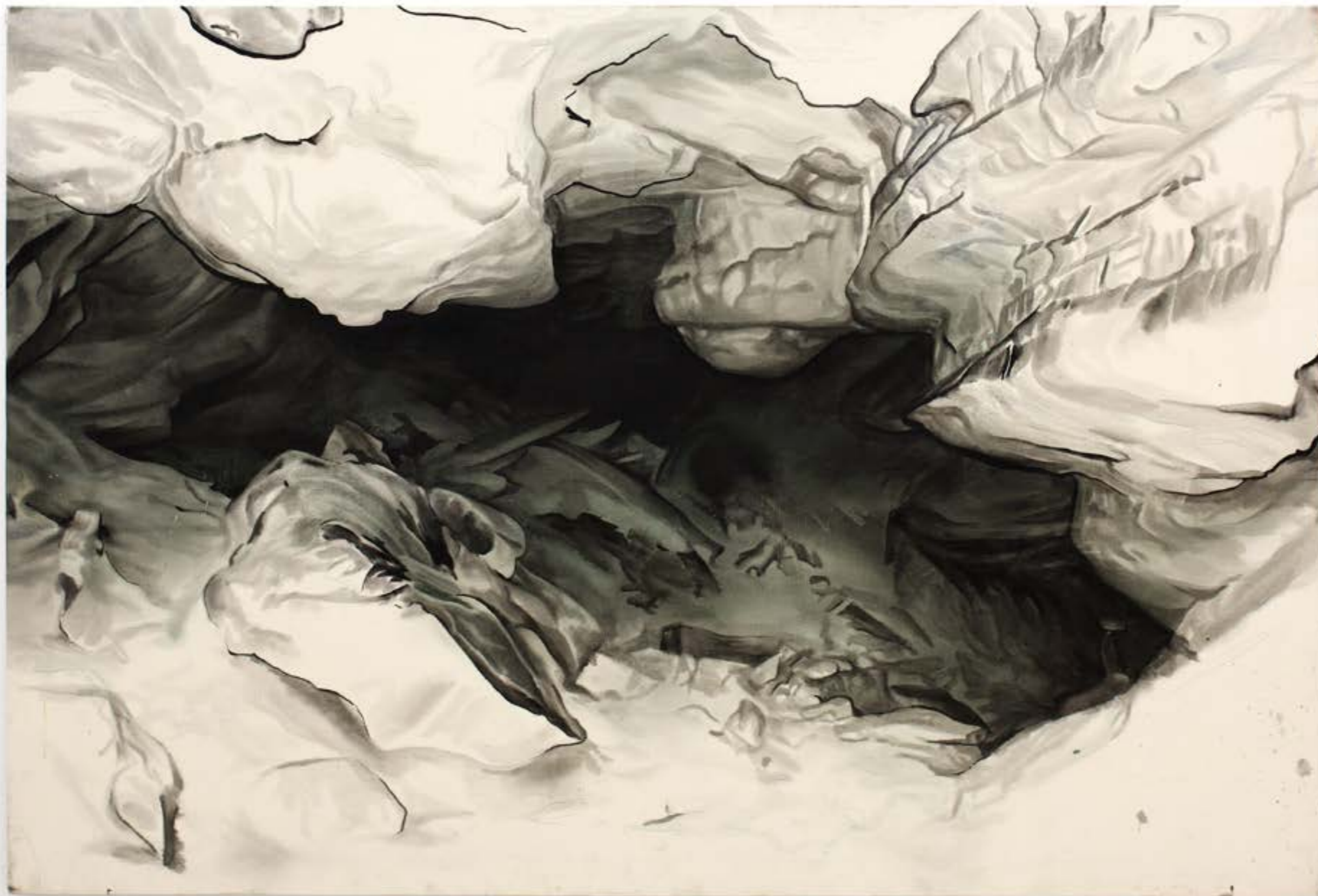
Salle des perles , 2024, huile sur toile, 200x135cm