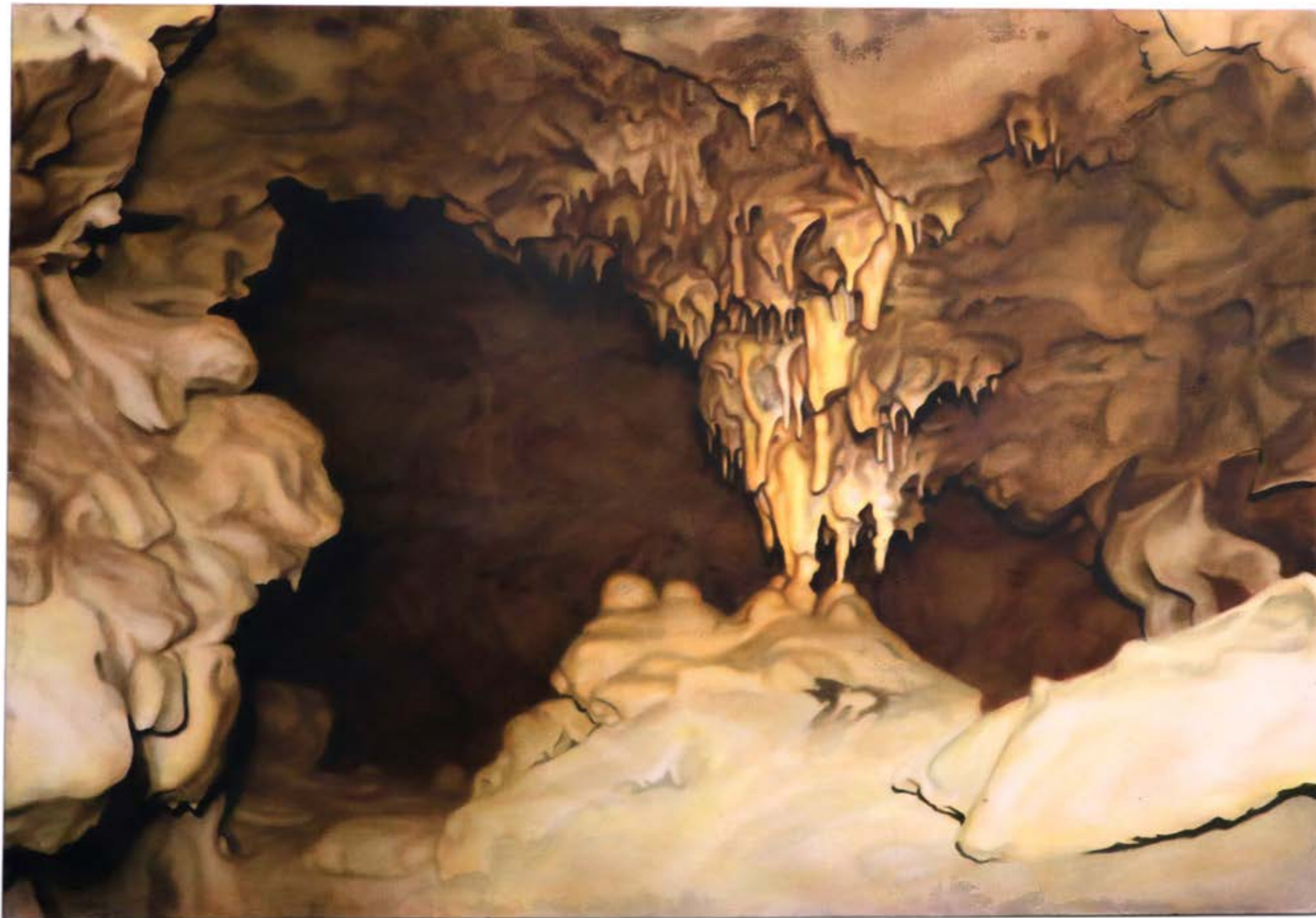
Gouttes de Léthé , 2025, huile sur toile, 200x135 cm