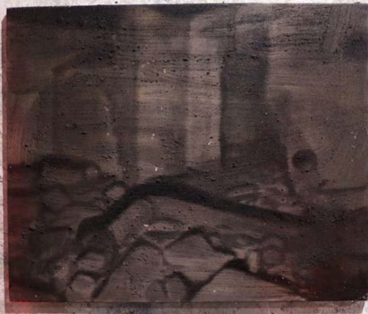
Everywhere at the end of times , 2025, sable, pigment et huile sur toile, 54x65 cm